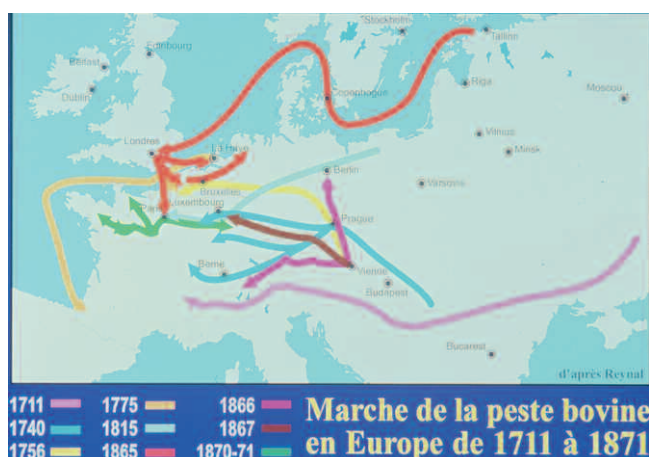
Figure 2 : Marche de la peste bovine en Europe de 1711 à 1871 (copyright OIE 1999).

depuis des millénaires et s'est souvent transmise aux pays voisins, et même à l'Australie en 1923 (Curasson 1932). Dans les Amériques, la peste bovine ne s'est pas implantée, malgré deux alertes consécutives aux importations des zébus indiens aux États-Unis d'Amérique (1920) et au Brésil (1921). La peste bovine ne semble plus persister aujourd'hui que sur un territoire très restreint, situé dans les zones de guerre de Somalie, d'où elle devrait être ou est peut-être déjà éliminée. Son agent pathogène deviendrait ainsi le premier virus animal dont l'éradication de la planète serait officiellement annoncée par l'OIE (figure 3).